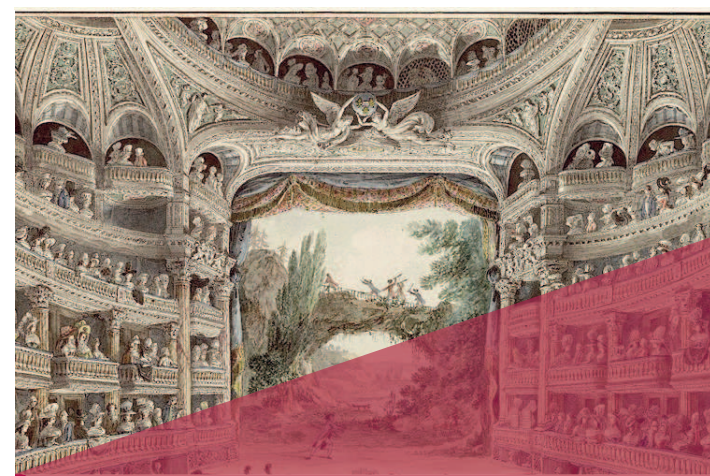
Illustration Comédie Française

200 avenue de la République | 92001 Nanterre | Tél. 01 40 97 72 00 www.u-paris10.fr