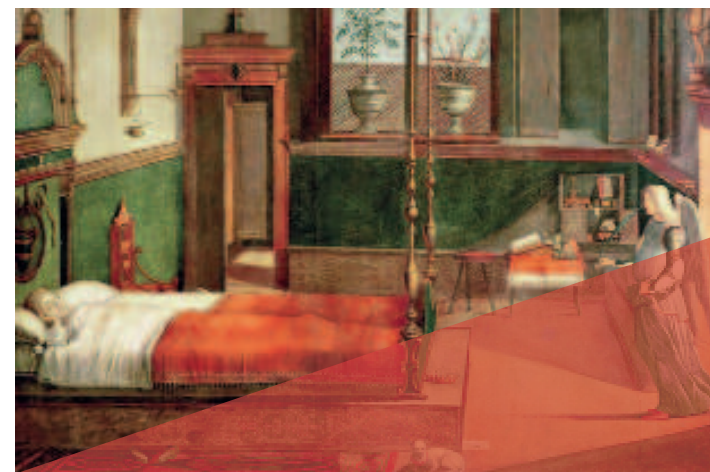
Illustration « Le Songe de sainte Ursule », Vittore Carpaccio (1495), Galerie de l'Académie, Venise

Par le train : Prendre le train à la gare Saint-Lazare, direction "Nanterre-Université" (ligne L), et descendre à la station "Nanterre-Université". Comptez quinze minutes de trajet.