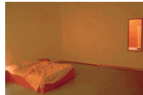
Dominique Gonzalez-foerster - Ada-Web et la chambre orange, villa arson, nice.