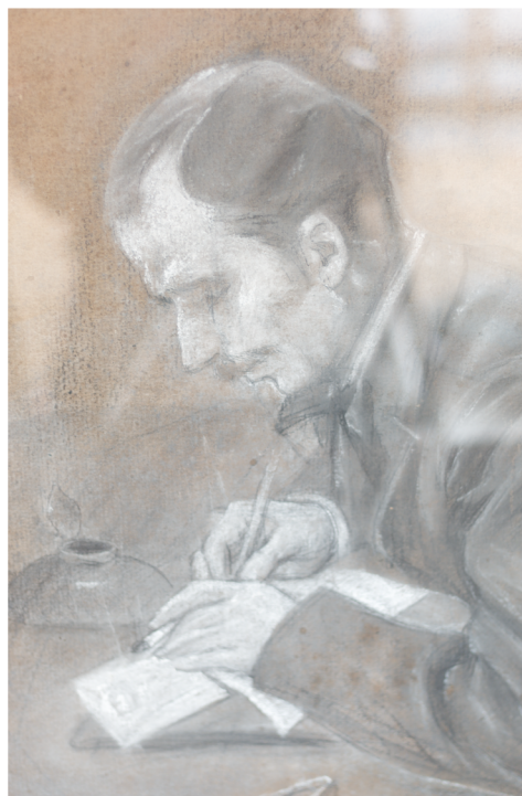
Portrait de Zévaco par Louis Legrand (Fonds Zévaco)

Cette exposition réunit trois fonds : le fonds Zévaco, conservé par sa descendance, la collection Philippe Donadille, et la collection Luce Roudier.